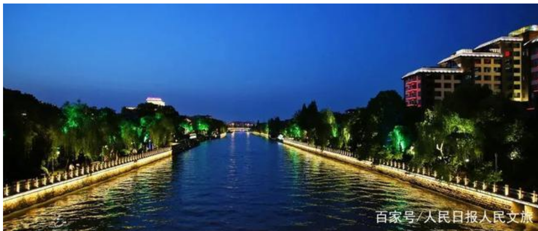
江苏扬州京杭大运河夜景

2020年5月12日，江苏省政府在上交所成功发行全国首只大运河文化带建设地方政府专项债券，期限10年，利率2.88%，规模23.34亿元，涉及江苏省大运河沿线11个市县的13个大运河文化带建设项目。这一创举，既拓宽了大运河文化带建设的募资来源，又极大地提振了受疫情影响较大的文化旅游产业发展信心。