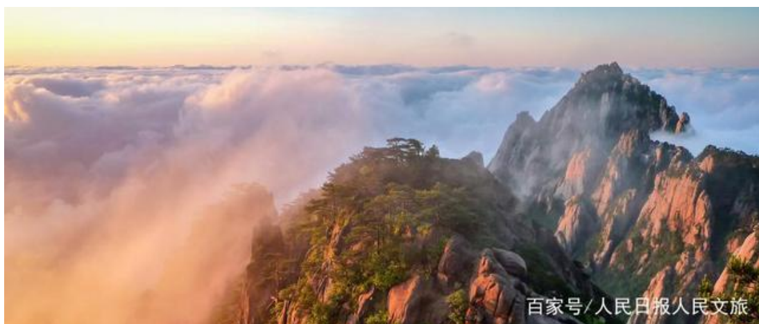
黄山风景区

王昆欣认为，如果十四五规划中提到的几个旅游目的地跨省区合作能够成功，可以为我们更多地区旅游文化发展的区域合作提供样板和经验。王昆欣以杭黄自然生态和文化旅游廊道为例，他表示，杭州和黄山这两个毗邻的地区，在旅游发展中有很多相似或可形成互补的地方。首先，杭州拥有西湖、大运河、良渚古城遗址三项世界文化遗产，是中国著名的风景旅游城市，黄山是世界自然和文化双遗产目的地，具有独特的自然风景。杭州和黄山，在旅游资源上可以形成互补。