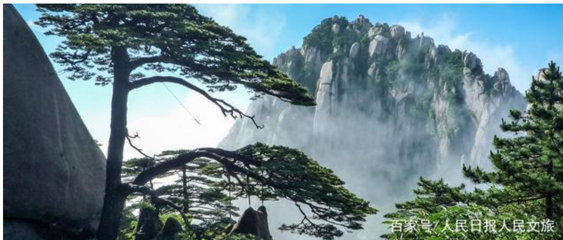
黄山风景区

去年6月，皖浙两省政府正式签订共建杭黄世界级自然生态和文化旅游廊道战略合作框架协议。随后，皖浙两省发展改革委共同拟定杭黄世界级自然生态和文化旅游廊道建设工作方案，并上报国家发展改革委。如今，杭黄自然生态和文化旅游廊道建设写入十四五规划。杭黄两地的合作是跨地域景区合作的一个典型。